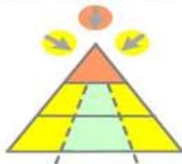
Аудит цифровой трансформации бизнеса